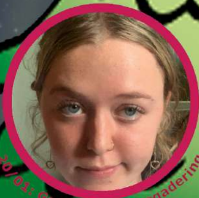
20/01: Grote Momo Vergadering