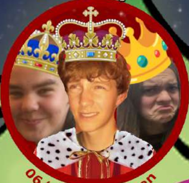
06/01: 3 koningen