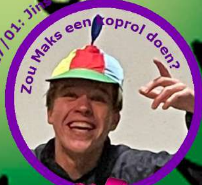
Zou Maks een coprol doen?